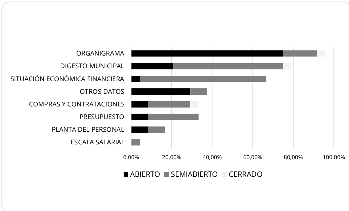
Gráfico 1. Clasificación de variables según porcentaje (%) de municipios que la publican